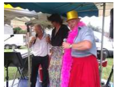
Cochon grillé 2011