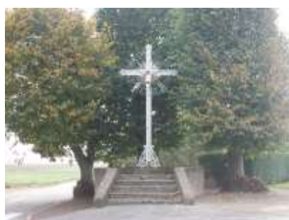
Avant travaux ...