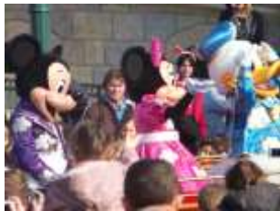
Voyage en Euro-Disney En mars 2009