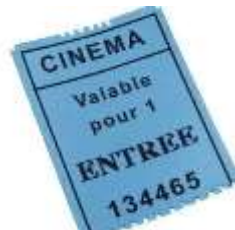
Tickets ou livres pour les moins de 18 ans en décembre 2010