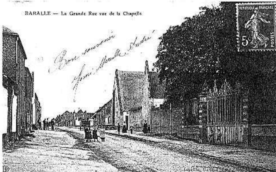
BARALLE - La Grande Rue vue de la Chapelle