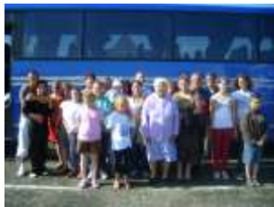
Voyage à Berck-Sur-Mer En juillet 2009