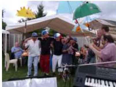
Cochon grillé 2010