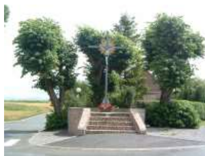
Après travaux ...