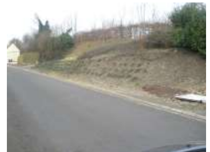
Talus allant vers le cimetière