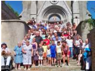
Cochon grillé 2009

Depuis 2009, le CCAS de Baralle organise chaque année un cochon grillé pour le plus grand plaisir des participants.