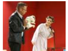
Spectacle de Magie En décembre 2011