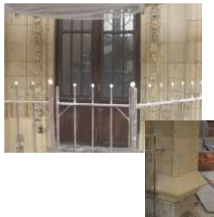
En cours de travaux ...