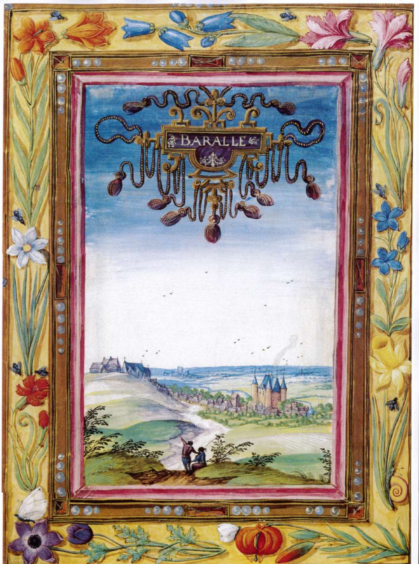
GRAVURE DE BARALLE DATANT DU MOYENNE AGE