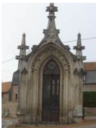
Avant travaux ...